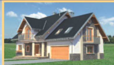
Widok od strony ogrodu